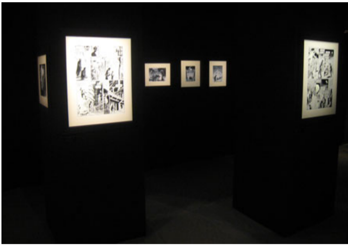
"Lumières sur Brüssel " au centre Wallonie-Bruxelles. Une scénographie qui met les originaux particulièrement en valeur.