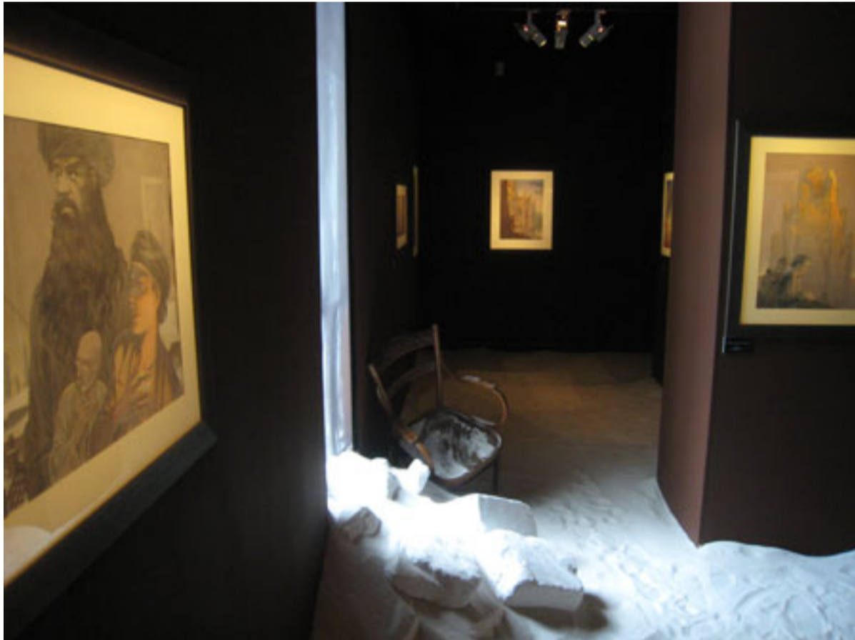
"Lumières sur Brüssel " au centre Wallonie-Bruxelles envahi par cinq tonnes de sable blanc.

Présentant depuis le 15 septembre des dessins originaux de l'album, plus un bon nombre d'inédits rejoignant ses thèmes, François Schuiten et Benoît Peeters ont réussi, avec l'aide de l'atelier scénographique Bleu Lumière, une installation dotée d'un éclairage et d'un espace sonore originaux. À voir jusqu'au 2 novembre.