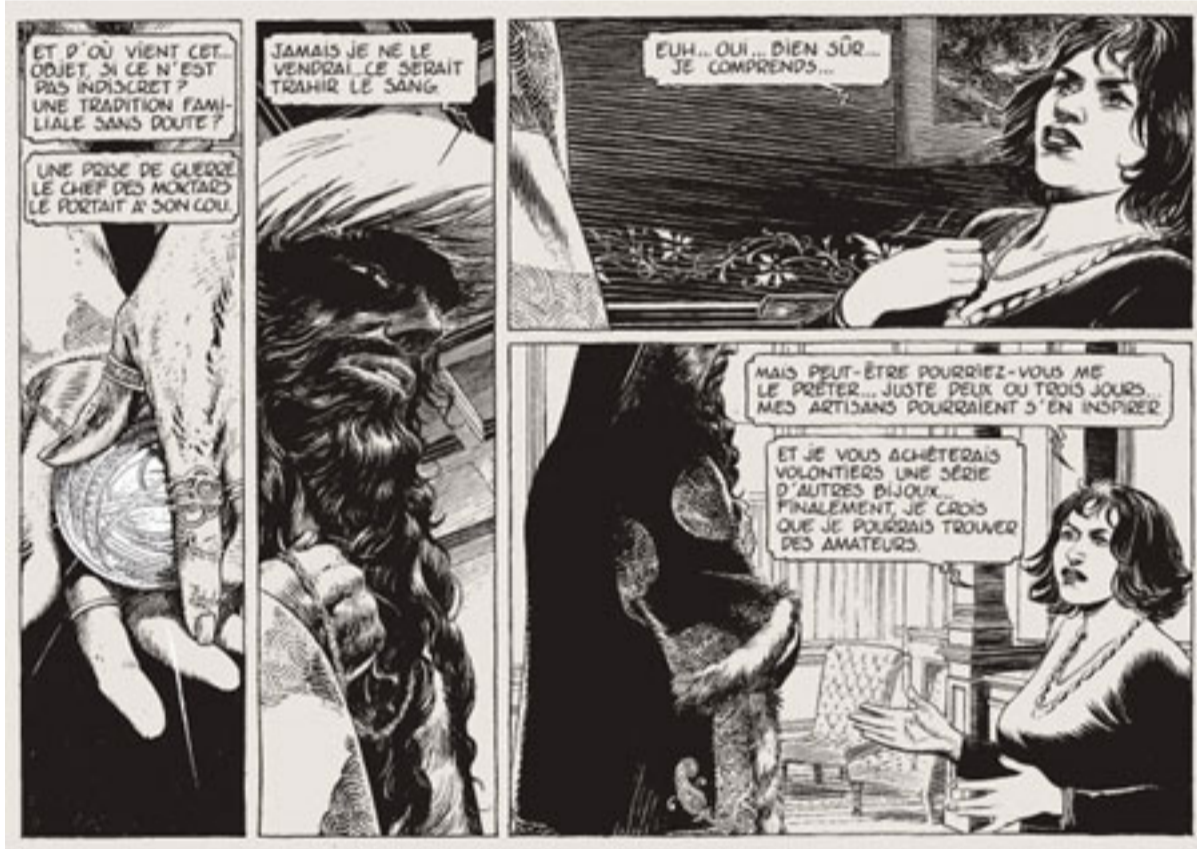
"La théorie du grain de sable" de François Schuiten et Benoît Peeters. Une édition en bichromie au format italien. Ed. Casterman

En forme de parabole, cette Théorie du grain de sable où l'on imagine que les auteurs apportent leur tribut à la réflexion sur les conséquences et les origines des événements du 11-Septembre, est autant fascinée par les utopies qu'inquiétée par leur dangerosité. Un album exemplaire des Cités obscures .