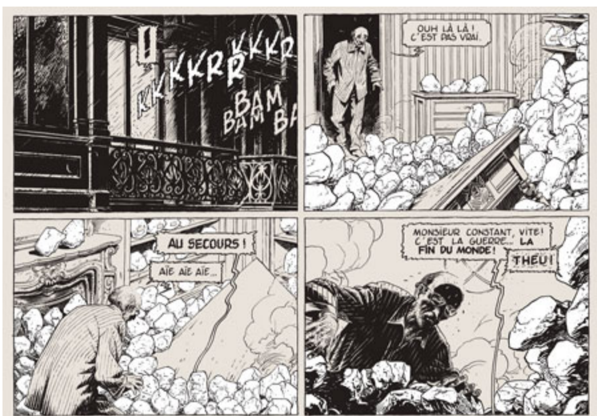
"La théorie du grain de sable" de François Schuiten et Benoît Peeters Ed. Casterman

En forme de parabole, cette Théorie du grain de sable où l'on imagine que les auteurs apportent leur tribut à la réflexion sur les conséquences et les origines des événements du 11-Septembre, est autant fascinée par les utopies qu'inquiétée par leur dangerosité. Un album exemplaire des Cités obscures .