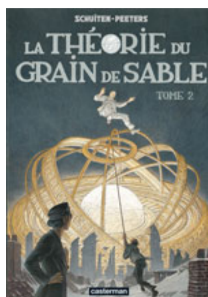
"La théorie du grain de sable" T.2 de François Schuiten et Benoît Peeters Ed. Casterman

La théorie du grain de sable ne procède pas autrement : à cause d'un acte irresponsable posé par l'homme, Brüssel est cette fois envahie par le sable et par les pierres, tandis que certains citoyens en perdent leur gravité. Comment ? Pourquoi ? Telles sont les questionnements qui interrogent la malédiction. Le bourgmestre Sleenck ne sait où donner de la tête devant ces catastrophes qui n'ont vraiment rien de naturel. Entamé dans un climat de fin du monde digne de L'Étoile mystérieuse , le récit se déploie comme dans un roman de Jules Verne avec une mission de savants envoyés au bout du monde pour résoudre une énigme venue d'une civilisation méconnue.