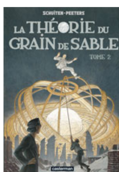
"La théorie du grain de sable" T.2 de François Schuiten et Benoît Peeters Ed. Casterman

La théorie du grain de sable ne procède pas autrement : à cause d'un acte irresponsable posé par l'homme, Brüssel est cette fois envahie par le sable et par les pierres, tandis que certains citoyens en perdent leur gravité. Comment ? Pourquoi ? Telles sont les questionnements qui interrogent la malédiction. Le bourgmestre Sleenck ne sait où donner de la tête devant ces catastrophes qui n'ont vraiment rien de naturel. Entamé dans un climat de fin du monde digne de L'Étoile mystérieuse , le récit se déploie comme dans un roman de Jules Verne avec une mission de savants envoyés au bout du monde pour résoudre une énigme venue d'une civilisation méconnue.