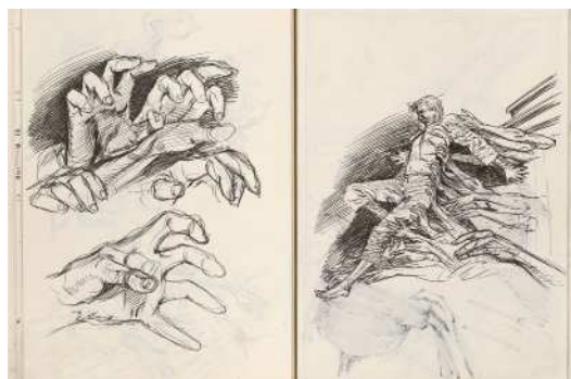
Extrait de L'Ombre d'un homme , François Schuiten et Benoît Peeters, 2008 Dessins, encre et crayon : Esquisses pour le cauchemar © Casterman 2009. Avec l'aimable autorisation des auteurs et des Editions Casterman BnF, Réserve des Livres rares