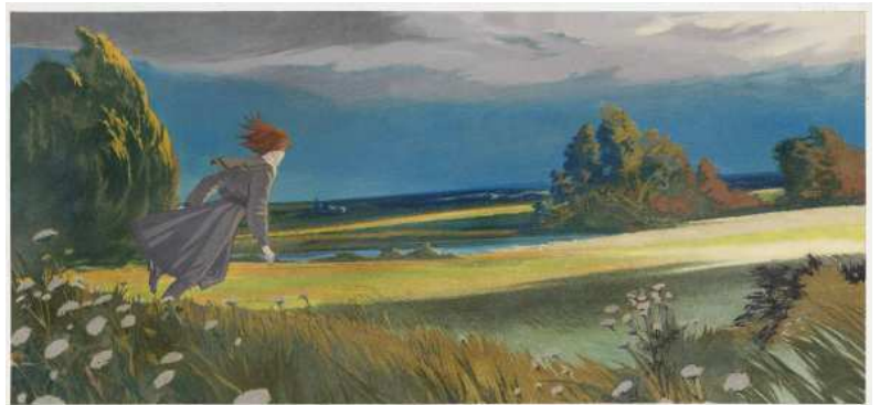
Extrait de Mary la penchée , François Schuiten et Benoît Peeters, 1995 Dessin original, gouache : Mary fuit dans la campagne , © Casterman 1995 Avec l'aimable autorisation des auteurs et des Editions Casterman BnF, Réserve des Livres rares