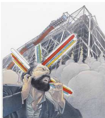
Extrait de L'étrange cas du Dr Abraham , François Schuiten et Benoît Peeters, 1987 Dessin pour couverture de A suivre , n°109, © Casterman 1987 Avec l'aimable autorisation des auteurs et des Editions Casterman BnF, Réserve des Livres rares