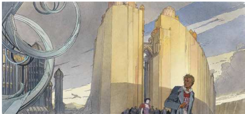
Extrait de Les Murailles de Samaris , François Schuiten et Benoît Peeters, 1988 Dessin pour la jaquette, encre et couleur © Casterman 1988. Avec l'aimable autorisation des auteurs et des Editions Casterman BnF, Réserve des Livres rares

Iconographie disponible dans le cadre de la promotion de l'exposition uniquement