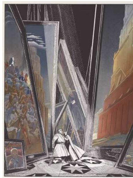
D'après La Tour , François Schuiten et Benoît Peeters, 1986 Lithographie : Les Tableaux , Galerie Christian Desbois. © Casterman 1987. Avec l'aimable autorisation des auteurs et des Editions Casterman BnF, Réserve des Livres rares