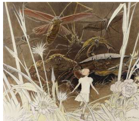
L'Enfant penchée, Quelques souvenirs par Mary von Rathen François Schuiten et Benoît Peeters, tirage de tête 1996 Dessin original, couleurs : Le second rêve de Mary : parmi les insectes