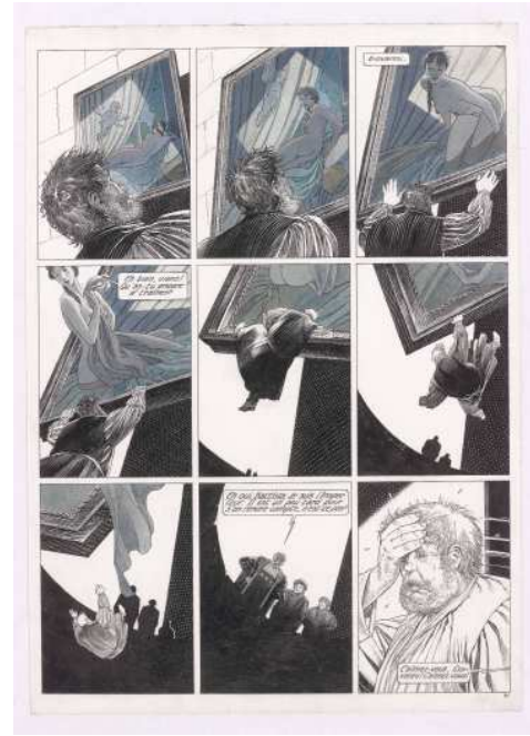
La Tour , François Schuiten et Benoît Peeters. Planche originale 41 : planche encrée et mise en couleur. © Casterman 1996 Avec l'aimable autorisation des auteurs et des Editions Casterman BnF, Réserve des Livres rares