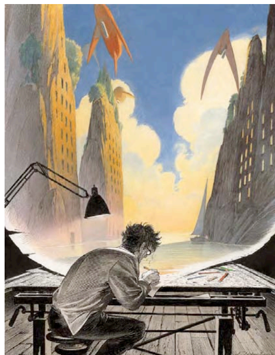
Autoportrait réalisé dans le cadre du Festival d'Angoulême 2003

CATALOGUE BIENTÔT EN LIGNE SUR LE SITE WWW.ARTCURIAL.COM